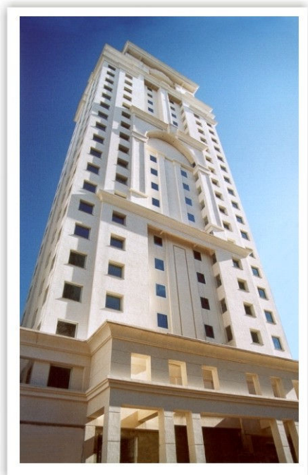
Vista do Edifício Sede da SISTEMA PRI Av. Angélica, 2546 - 14º/15º/16º andares Consolação – São Paulo – SP

Totalmente informatizada, a Sistema PRI dispõe de modernas instalações de processamento de dados (CPD), softwares, projetos assistidos por computador, processamento de imagens por computador, centro de digitação, equipamentos profissionais de vídeo, e uma ilha de edição completa.